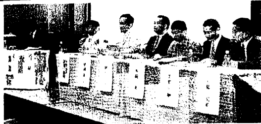
議会の役割や改革の方向性などを模索したパネルディスカッション

首都圏以外で初の開催となる、議会改革をテーマにした市民と議員の交流会議「変わる議会・会津から」は6日、会津若松市で開かれた。遠くは北海道や広島県など県内外から議員や議会事務局職員、住民ら約230人が参加、全体会や分科会を通して地方分権が進む中での議会の役割や改革の方向性を考えた。